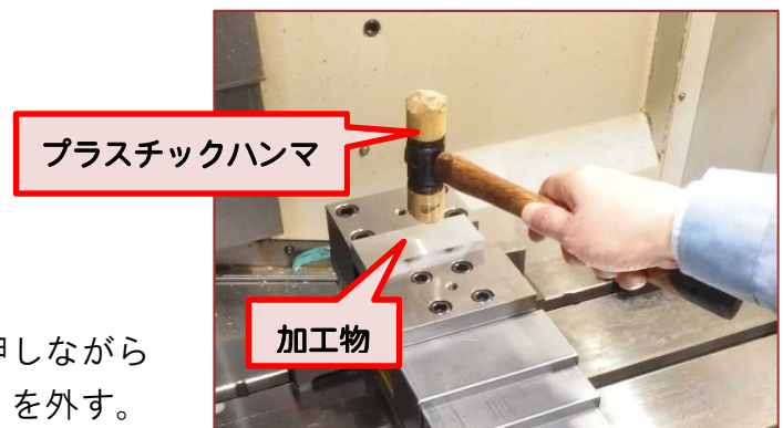
図3 プラスチックハンマーで叩く